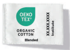
含量至少70%的有机棉